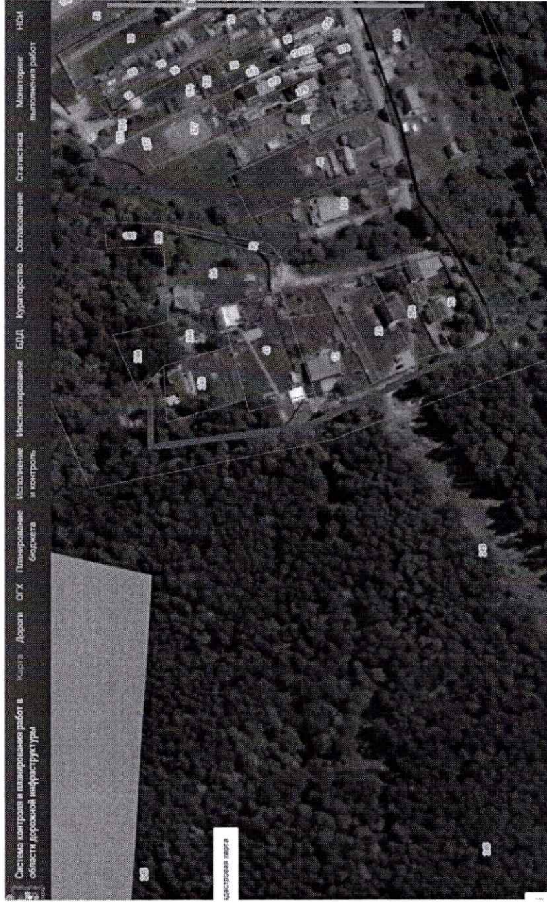
Схема расположения автомобильной дороги общего пользования местного значения, расположенной по адресу: Московская область, Рузский городской округ, д. Контемирово