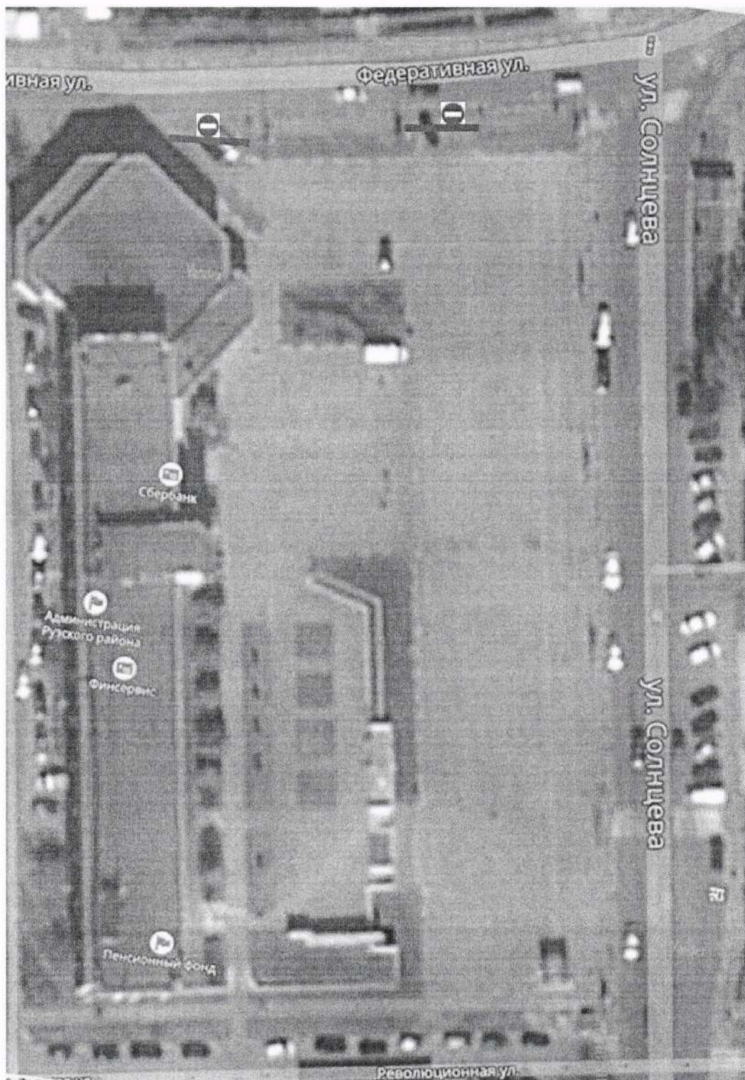
Схема перекрытия площади на 08 июля 2018 года с 06:00 до 20:30

Приложение №2 Утверждено постановлением Главы городского округа от 03.07.18 № 2508