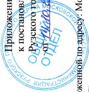
Схема расположения автомобильной дороги общего пользования местного значения, расположенной по адресу: Московская область, Рузский городской округ, р. п. Тучково, к СНТ «Рассвет»

к постановлению Администрации Рузского городского округа от 01.09.2021 № 3973