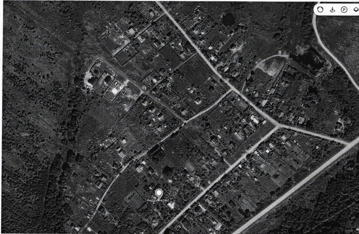
Схема расположения автомобильной дороги общего пользования местного значения, расположенной по адресу: Московская обл., Рузский городской округ, д. Андрейково, ул. Луговая