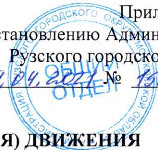
СХЕМА ПЕРЕКРЫТИЯ (ОГРАНИЧЕНИЯ) ДВИЖЕНИЯ АВТОТРАНСПОРТА НА 09.05.2021 ГОДА В П. ДОРОХОВО В ПЕРИОД ПРОВЕДЕНИЯ ПРАЗДНИЧНЫХ МЕРОПРИЯТИЙ с 10.30 до 12.30

Приложение 2 к постановлению Администрации Рузского городского округа от 29.04.2021 № 1529