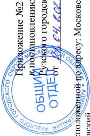
Схема расположения автомобильной дороги общего пользования местного значения, расположенной по адресу: Московская область, Рузский городской округ, г. Руза, пер. Новоивановский