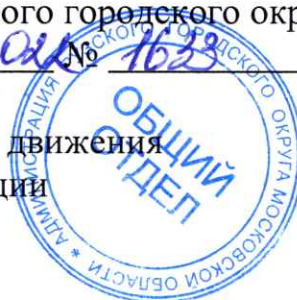
Схема перекрытия (ограничения) дорожного движения в г. Руза на время проведения репетиции торжественного парада