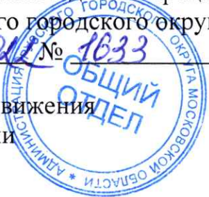
Схема перекрытия (ограничения) дорожного движения в г. Руза на время проведения репетиции торжественного парада