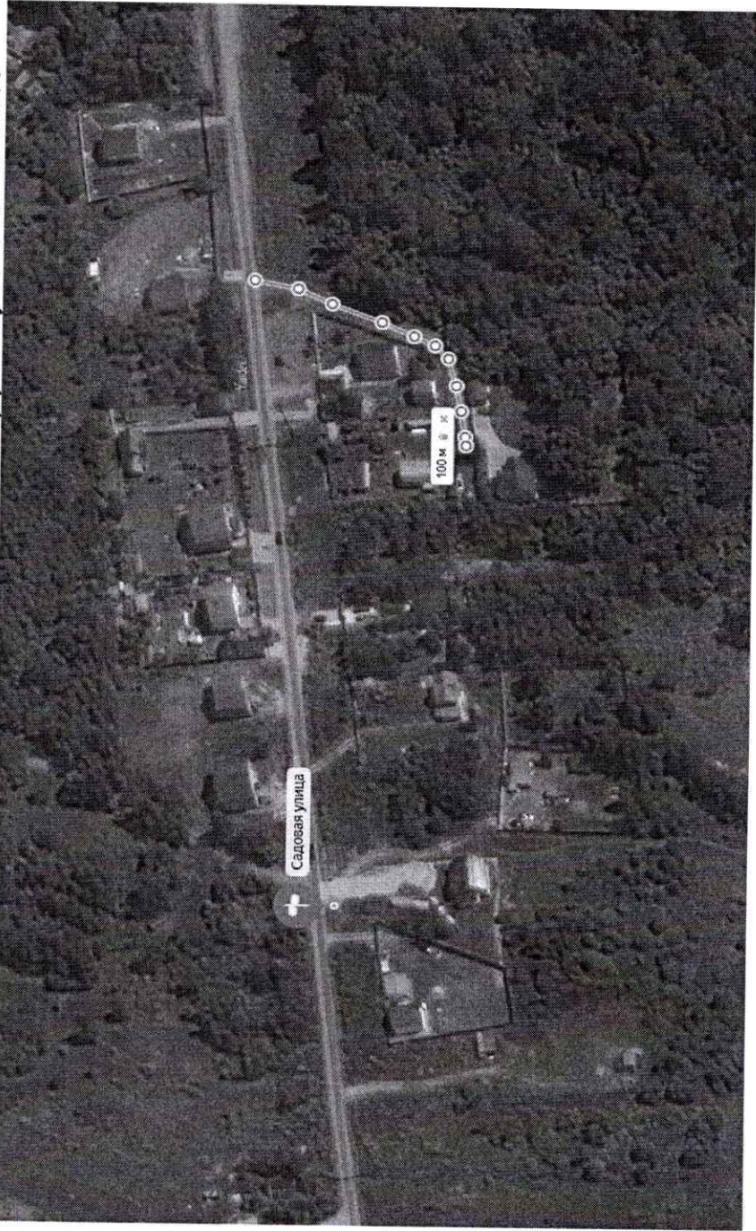
Схема расположения автомобильной дороги общего пользования местного значения, расположенной по адресу: Московская область, Рузский городской округ, п. Дорохово, ул. 2-я Садовая, к земельному участку 50:19:0040501:370

Приложение №2 к постановлению Администрации Рузского городского округа от 14.10.2021 № 4255 Приложение №2 к постановлению Администрации Рузского городского округа от 14.10.2021 № 3972